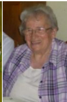
Anfang August feierten wir mit meiner Mutter ihren 79. Geburtstag!!